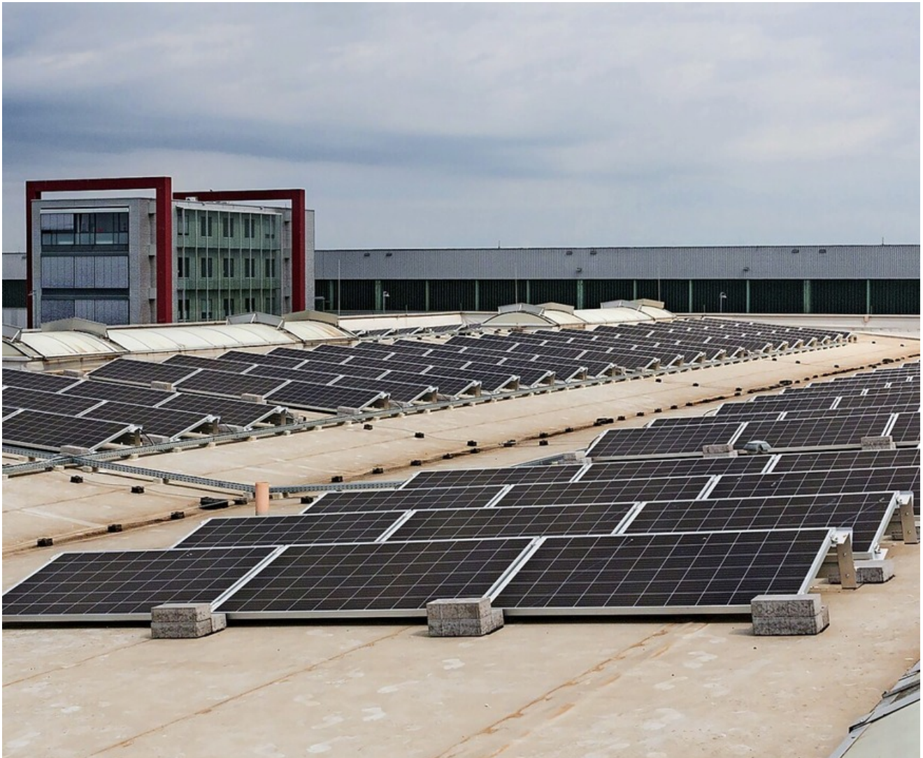
Mehr als 300 Solarmodule auf dem Dach der Produktionshalle der Lahrer Firma BUT mit einer mit einer Gesamtleistung von 99,99 KWp liefern Strom für die Laser-, Stanz- und Kantmaschinen.

Von BZ-Redaktion Fr, 06. August 2021 Lahr