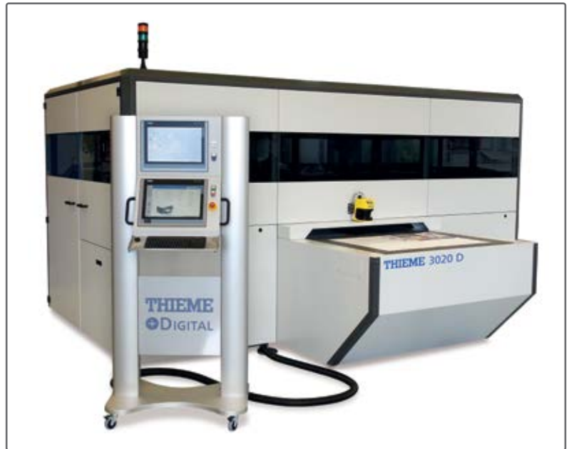
Eine Vielzahl an Blechteilen der THIEME Digitaldruckmaschine 3000D wird von BUT gefertigt