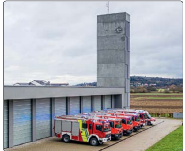
Die modernen und hochwertigen Feuerwehrfahrzeuge von WISS sind in ganz Europa im Einsatz