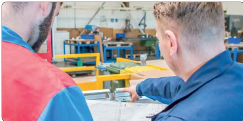
Einweisungen und Projektgespräche mit den Mitarbeitern sind wichtige Aufgaben des Fertigungsleiters bei BUT